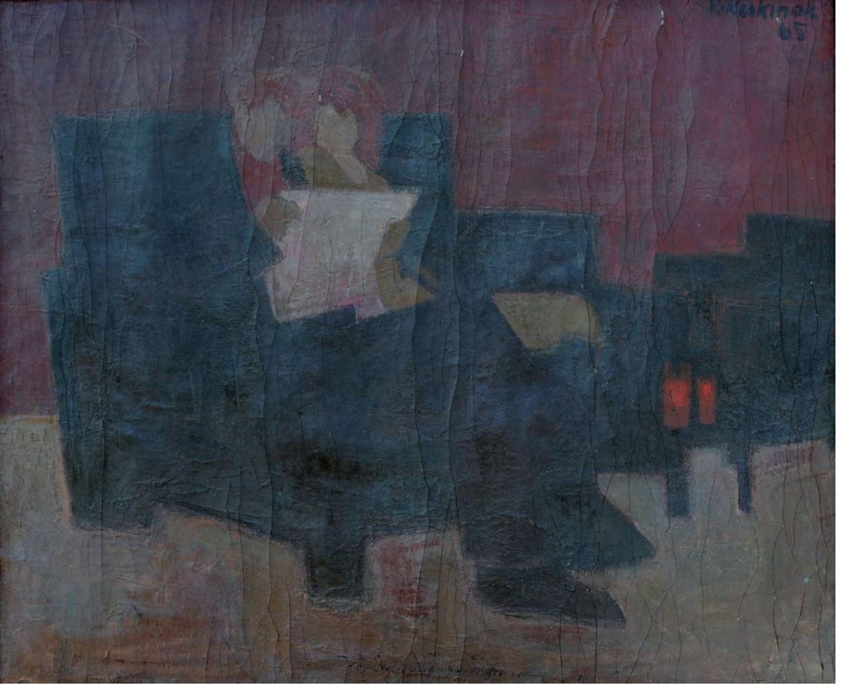
ÇOCUKSUZ AİLE, 1965, 74 x 90 Tuval üzerine yağlıboya