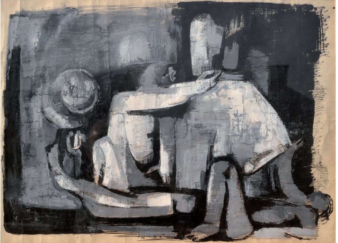
FANTASTİK RESİMLERE DOĞRU ARAYIŞLAR, 1960'lı yılların ortası, 46 x 63 Kağıt üzerine yağlıboya