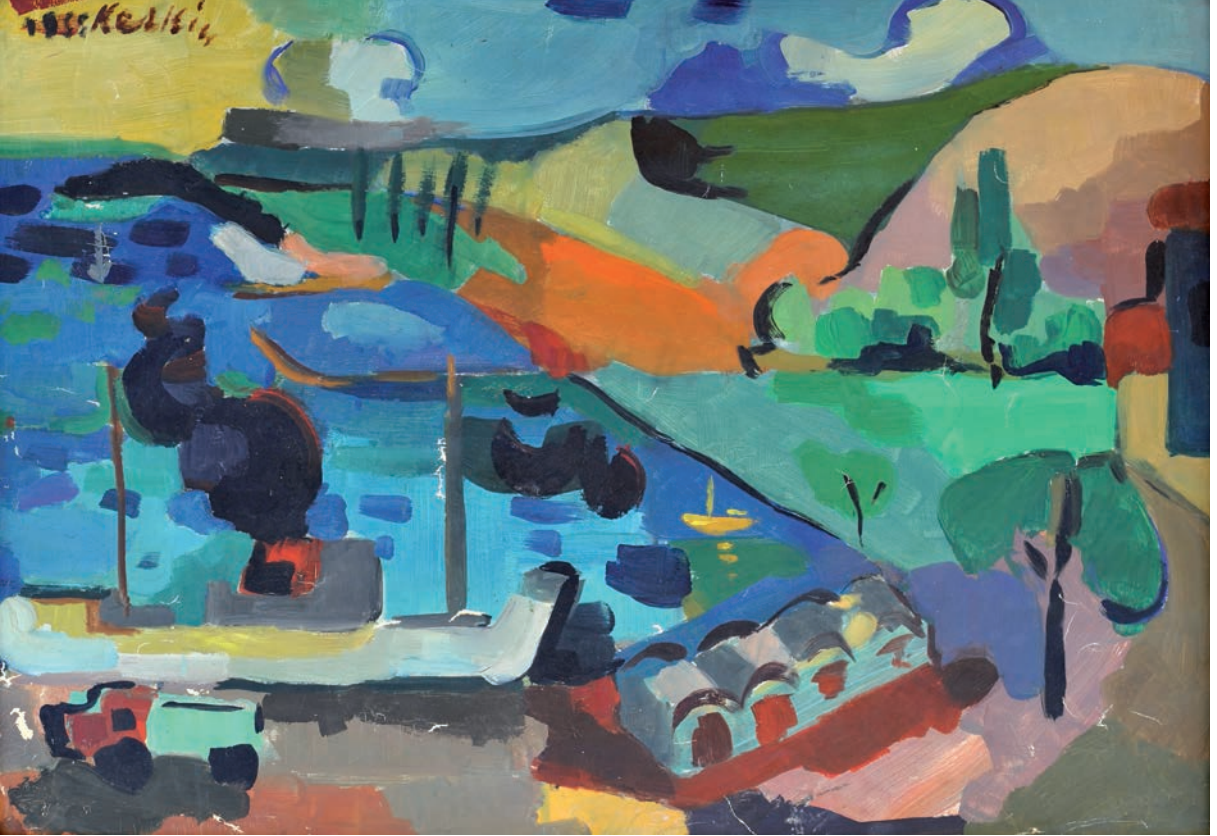
PEYZAJ, 1955, 42 x 54 Kağıt üzerine yağlıboya