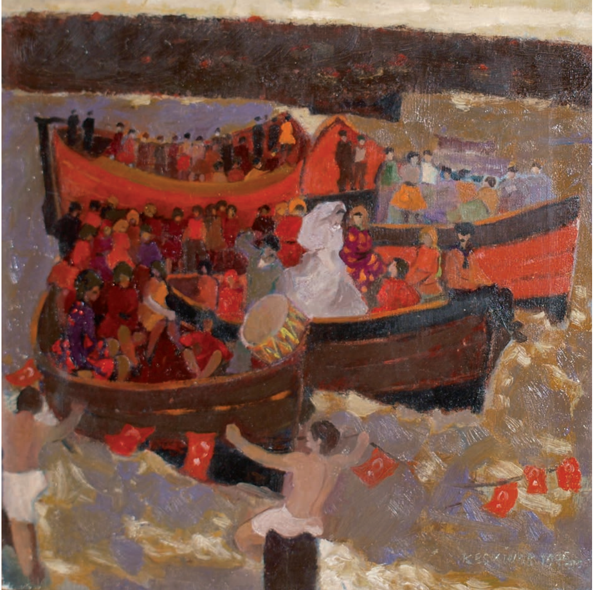
KARADENİZ'DE DÜĞÜN, 1975, 37.5 x 37.5 Tuvall üzerine yağlıboya