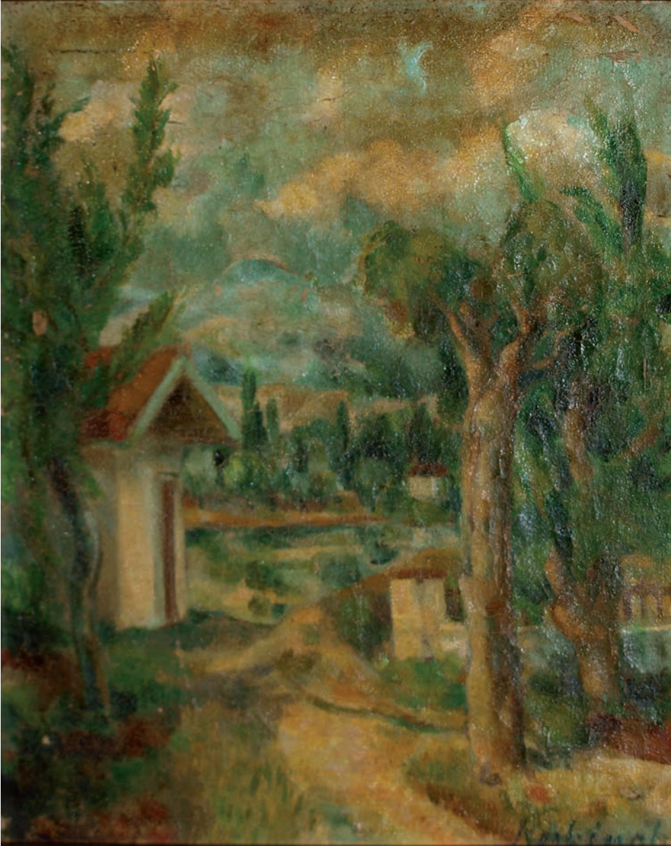
OSMANCIK'TAN PEYZAJ, 1952, 40 x 32 Tual üzerine yağılıboya