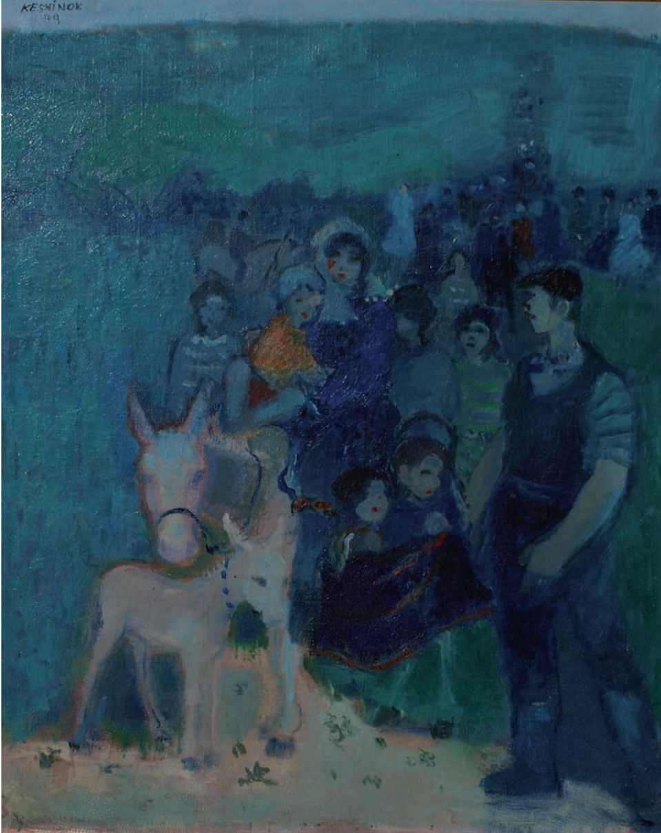
YAYLA DÖNÜŞÜ, 1979, 45 x 34 Duralit üzerine yağlıboya