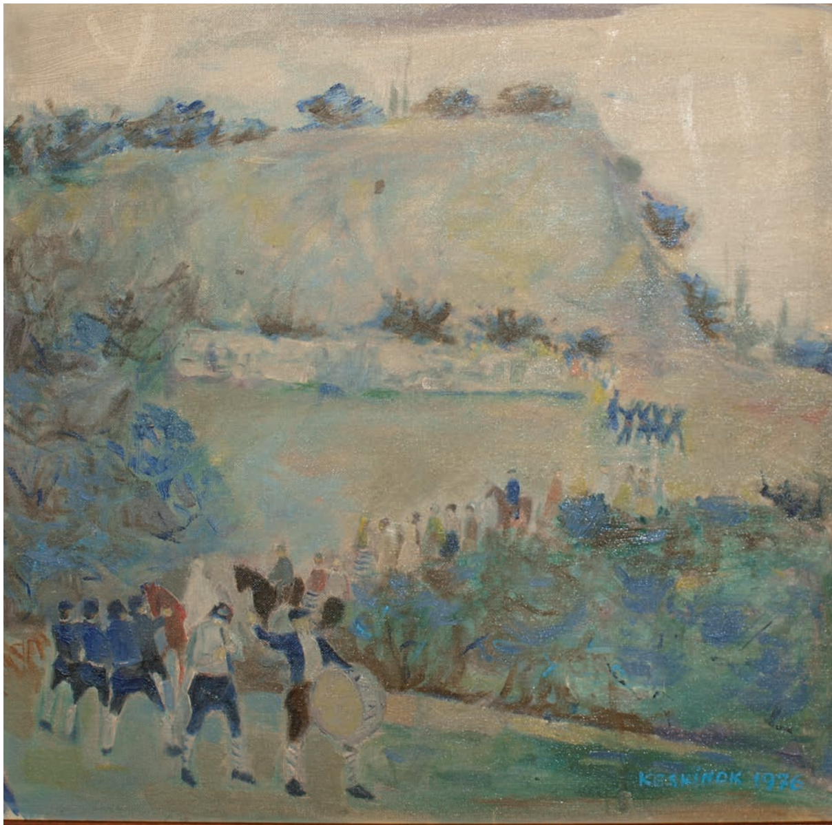
GELİN GETİRME, 1976, 45.5 x 46.5 Tuval üzerine yağlıboya