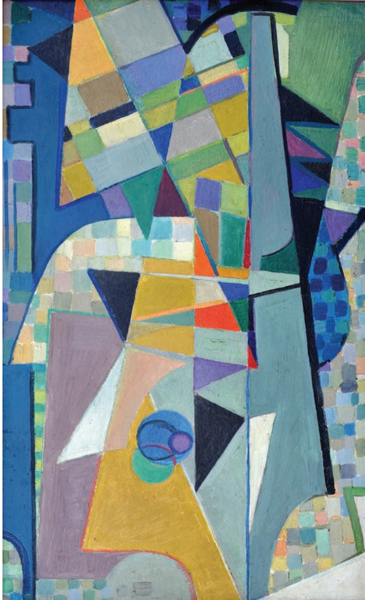
SOYUT PEYZAJ, 1955, 66 x 40 Mukavva üzerine yağılıboya