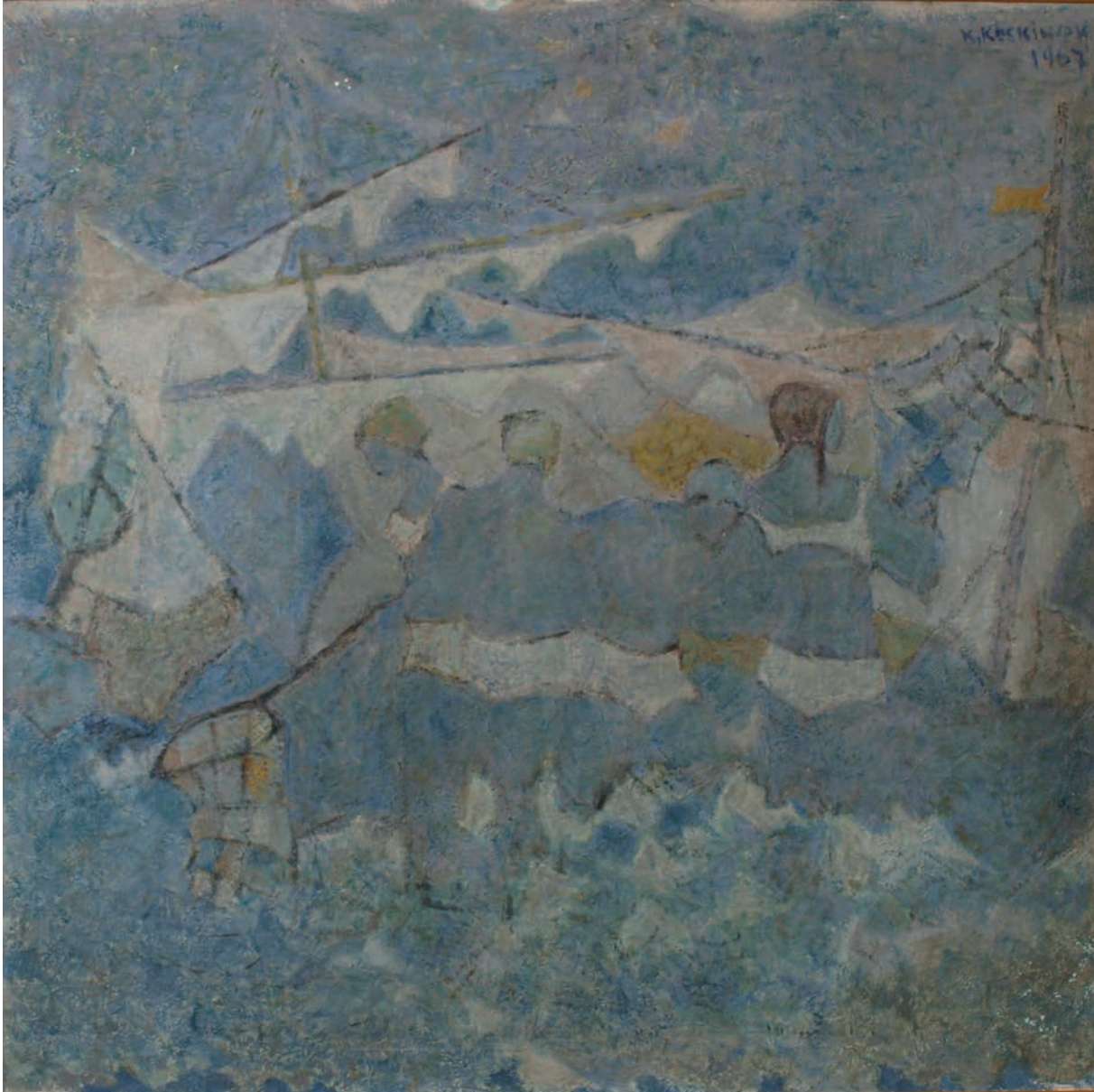
GEL GİT, 1967, 90 x 90 Tuval üzerine yağlıboya