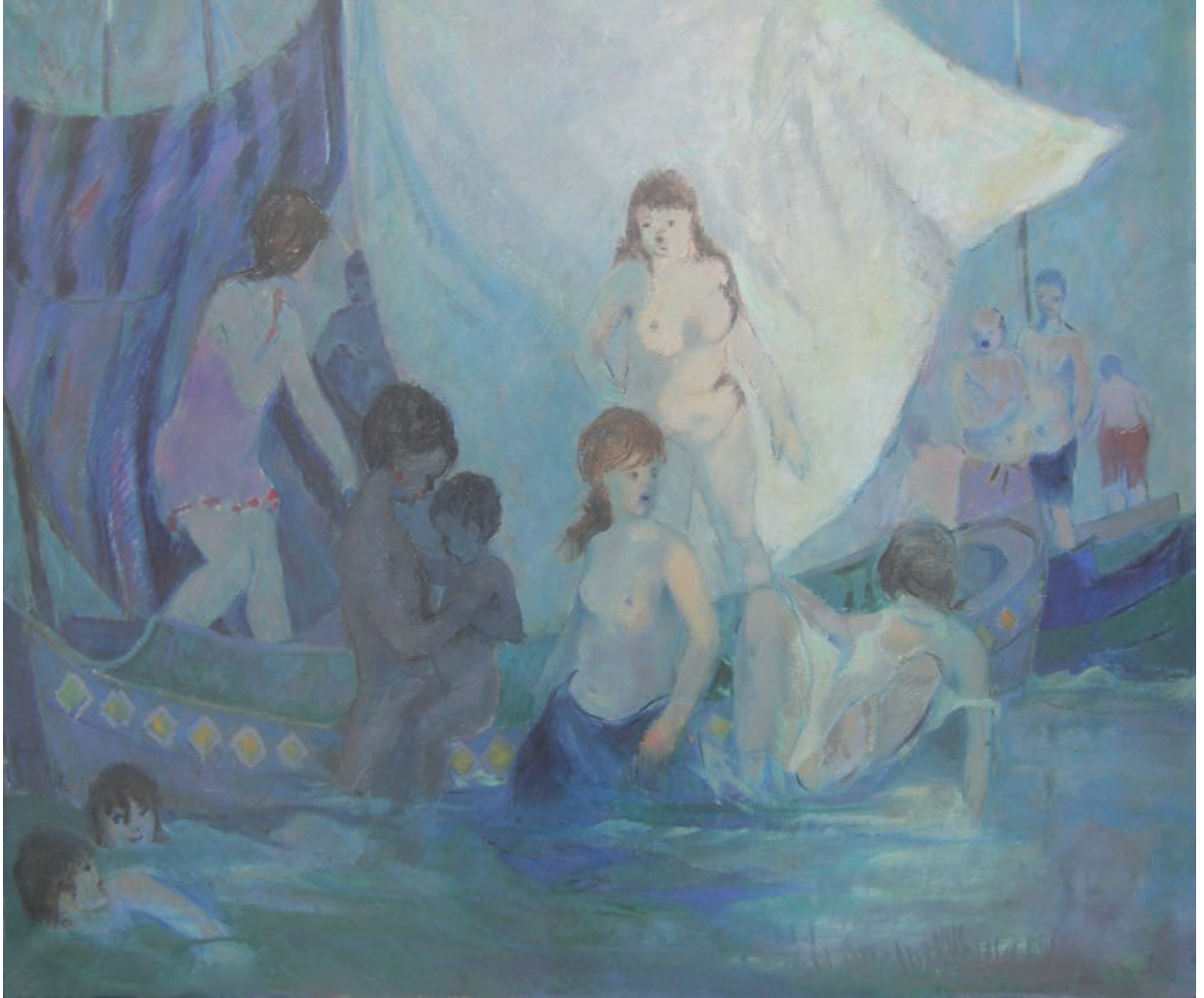
KARADENİZ'DE MAYIS YEDİSİ, 1971, 76 x 87 Tuval üzerine yağlıboya