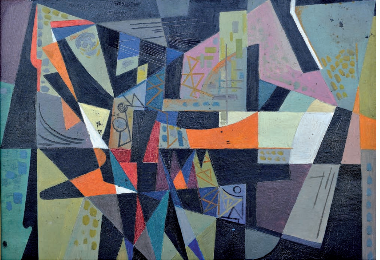
SOYUT DÜZENLEME, 1950'ler, 48 x 68 Mukavva üzerine yağlıboya