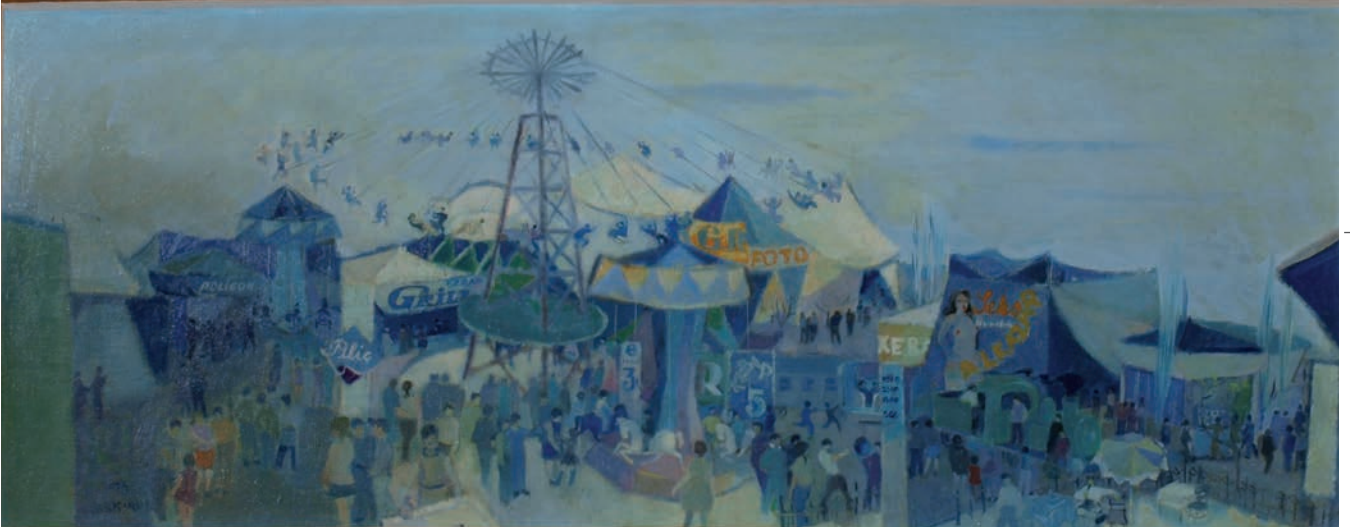
LUNAPARK, 1976, 32 x 81 Duralit üzerine yağlıboya