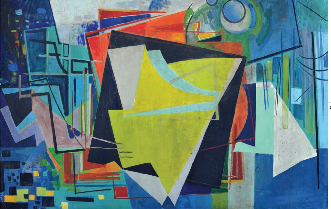
DÜŞ KIRIKLIĞI, 1950'ler, 84 x 131 Tuval üzerine yağlıboya