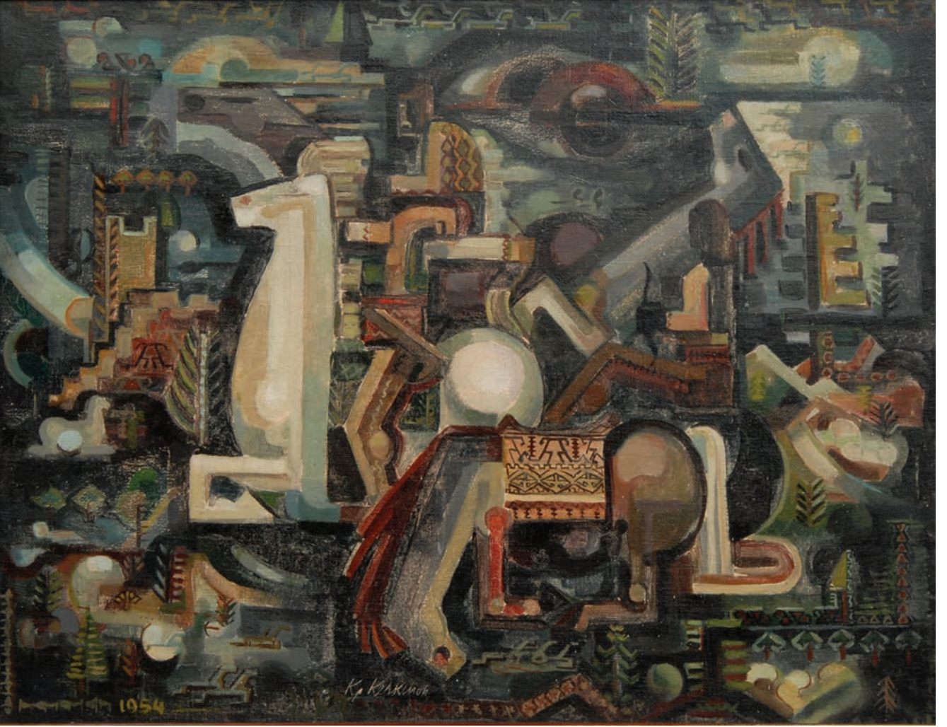
KÖROĞLU, 1954, 55 x 70 Tual üzerine yağlıboya