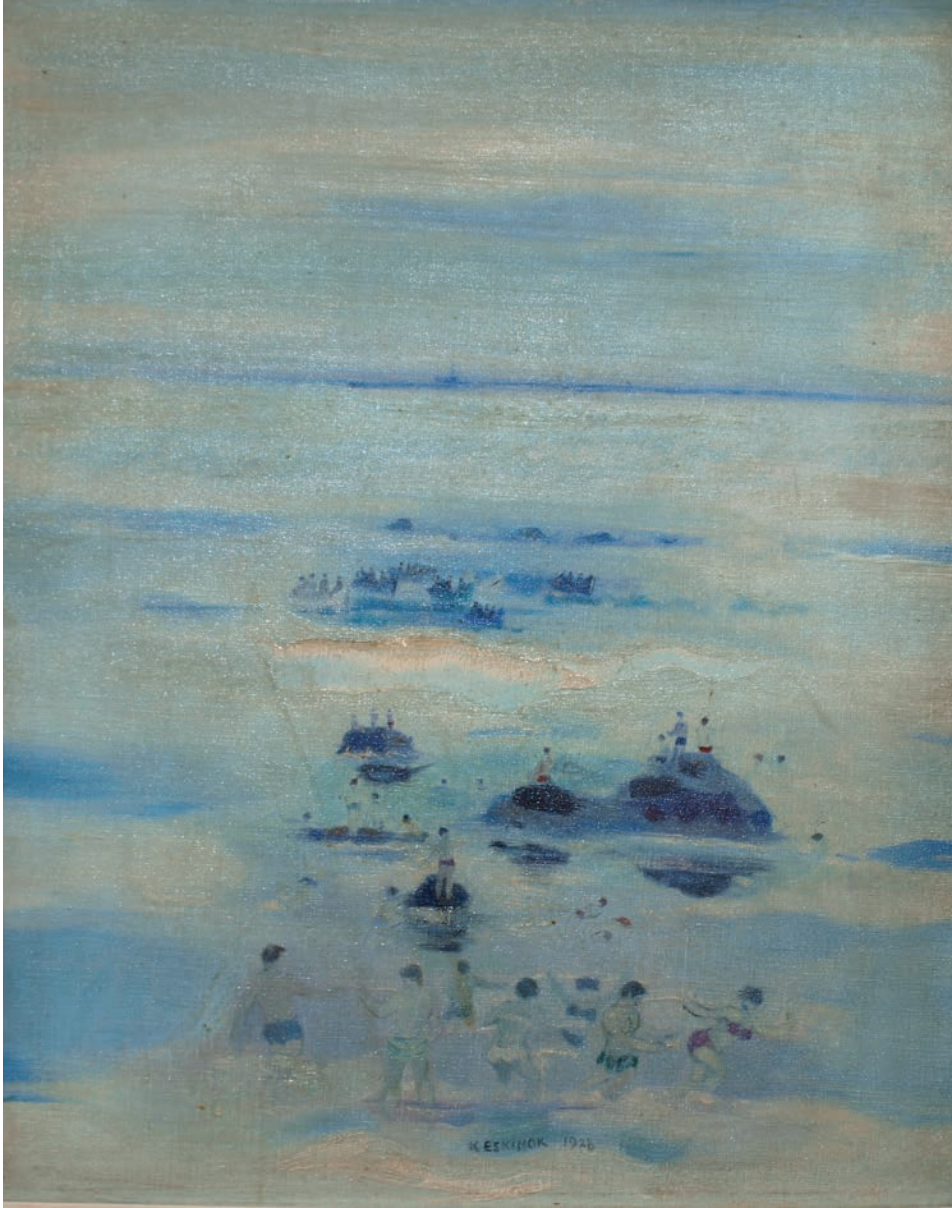
DENİZDE KIVANÇ, 1978, 59.5 x 48 Tual üzerine yağlıboya