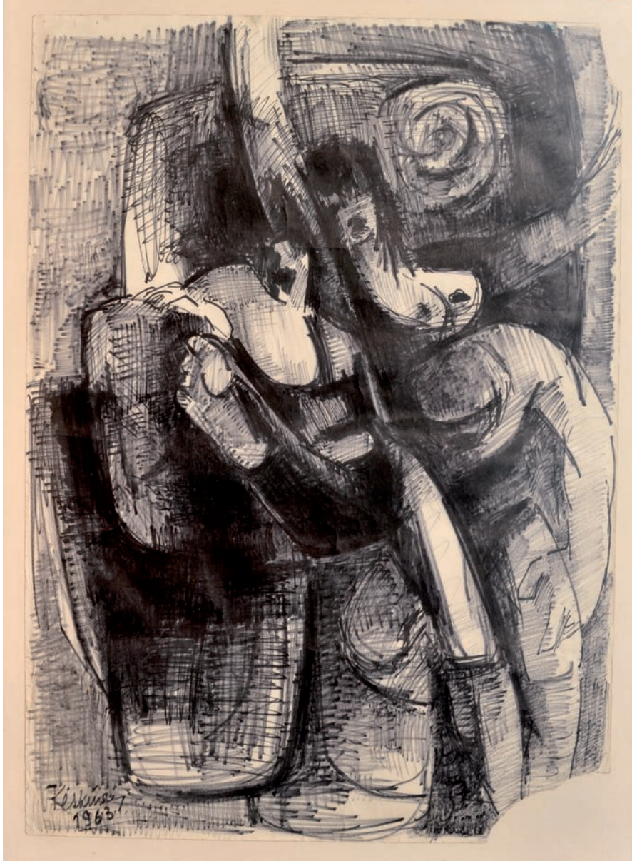
FANTASTİK RESİMLERE DOĞRU ARAYIŞLAR, 1963, 70 x 50 Kağıt üzerine mürekkepli kalem