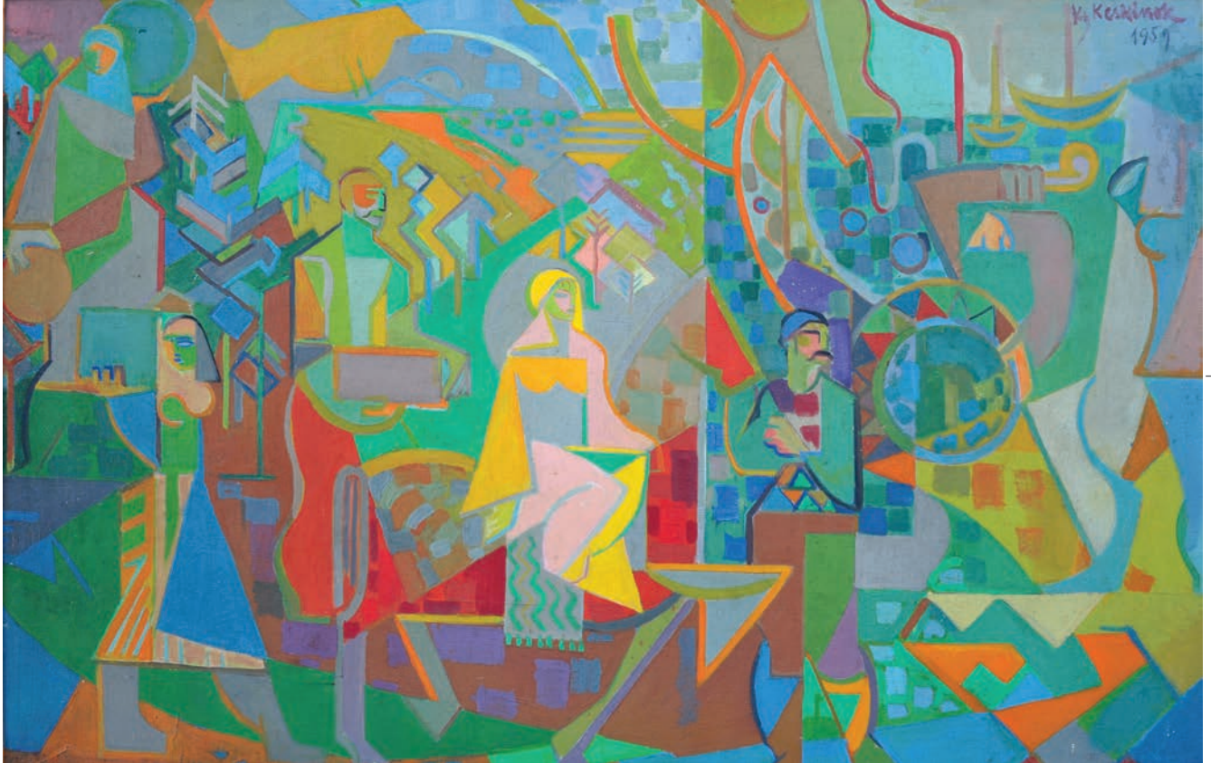
HASAT, 1959, 80 x 126 Tuval üzerine yağlıboya