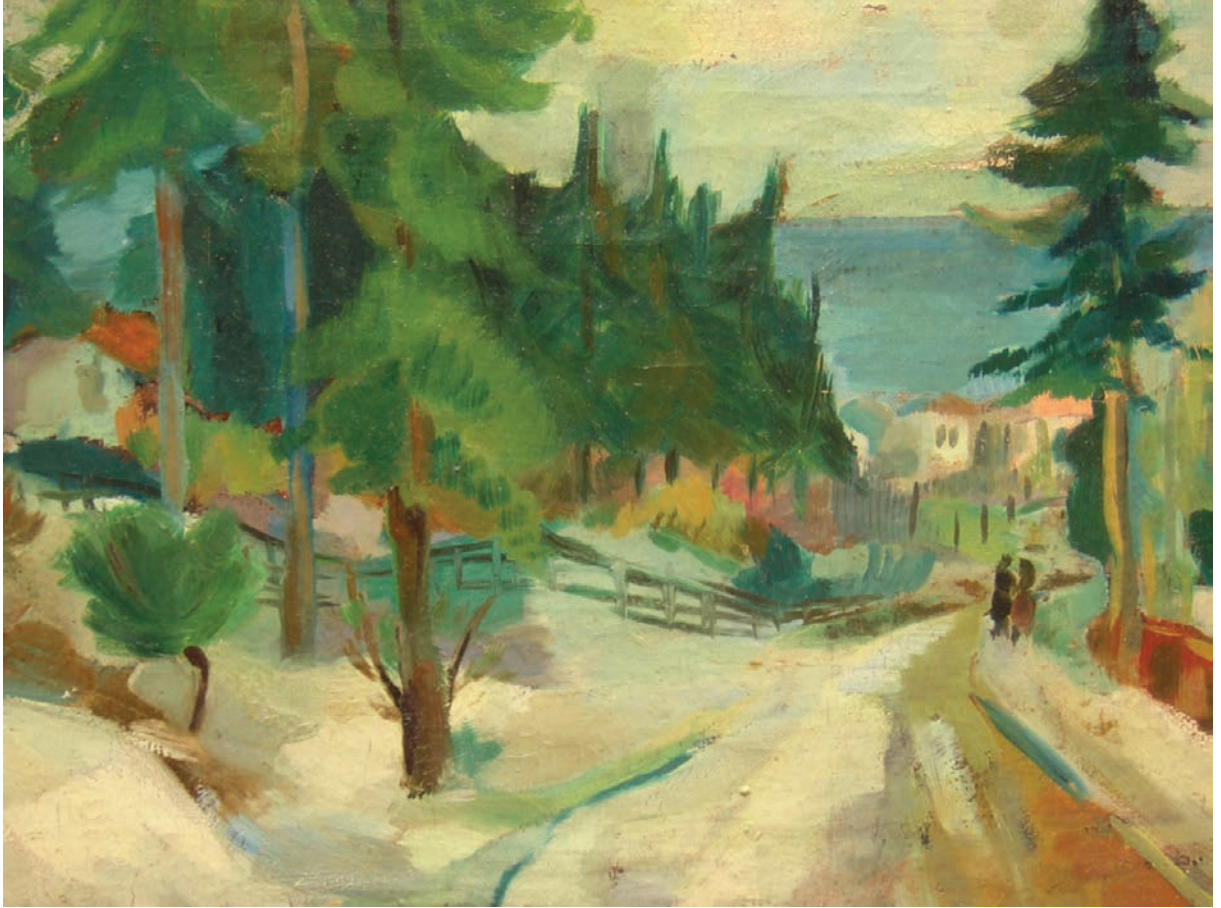
KARLI PEYZAJ, 1951, 39.5 x 52 Tuval üzerine yağlıboya