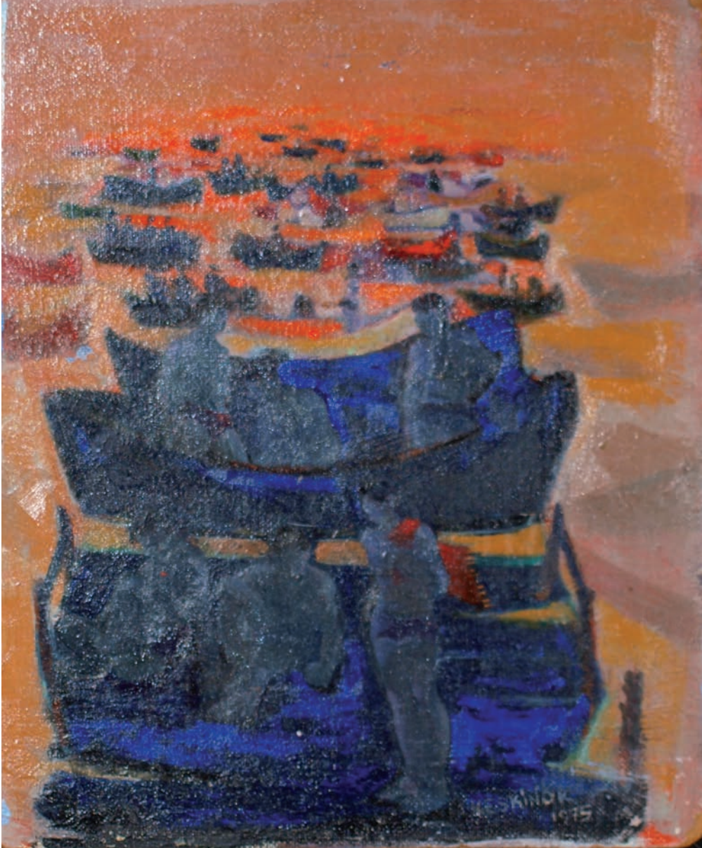
KARADENİZ'DE TEMMUZ, 1975, 50 x 40 Duralit üzerine yağlıboya