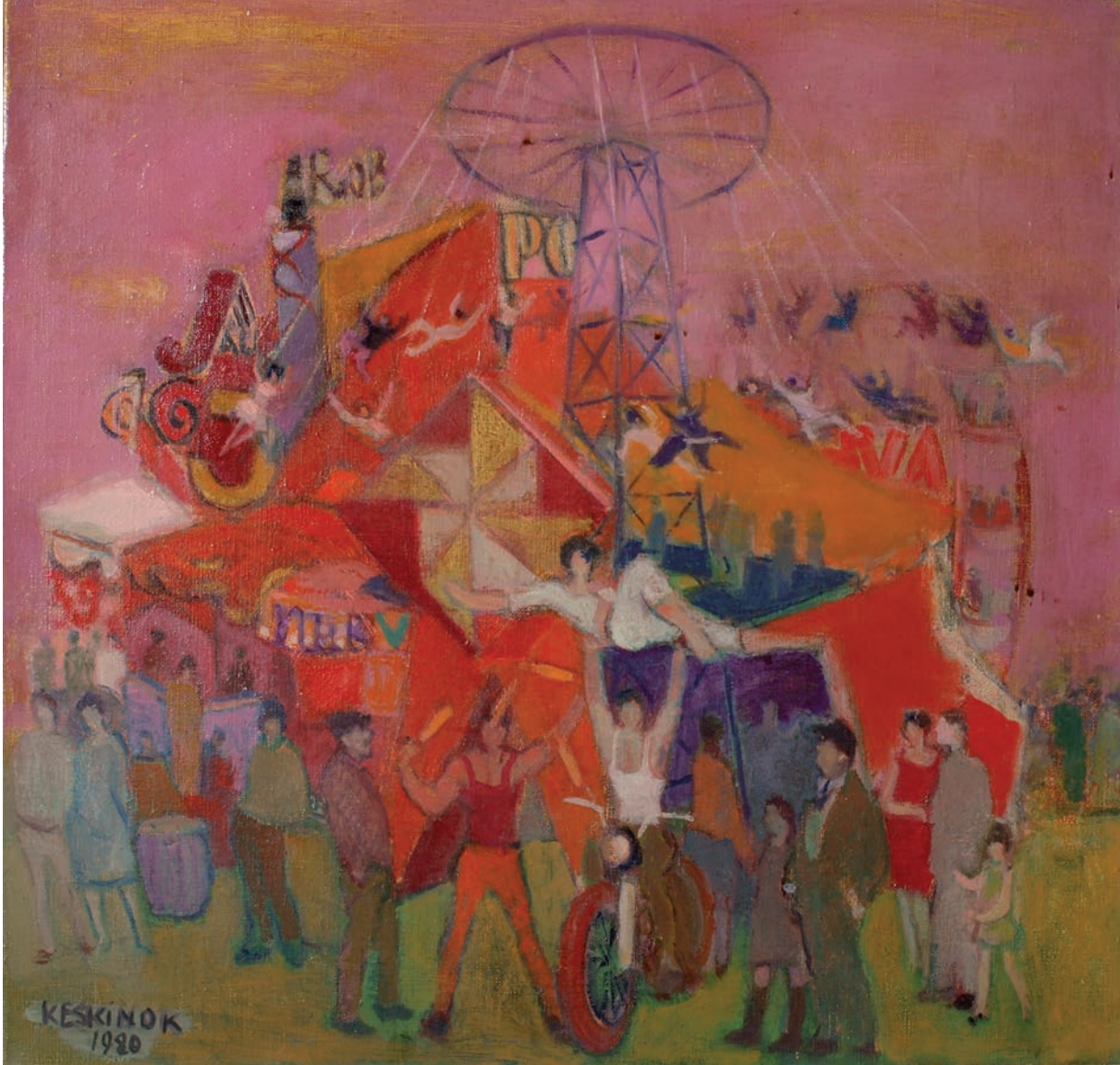
LUNAPARK, 1980, 52.5 x 57.5 Tuvall  zerine yađlıboya