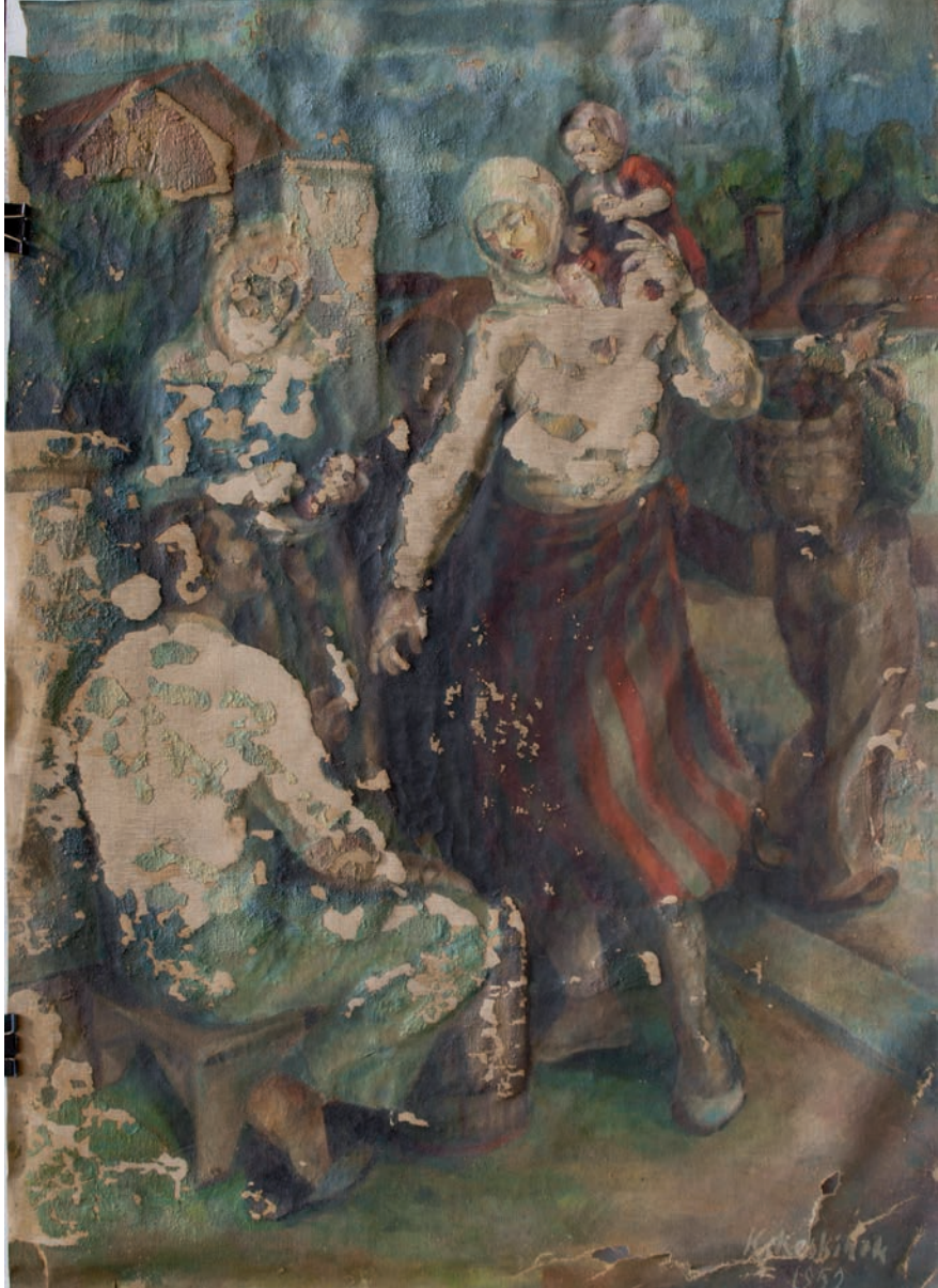
DONDURMACI BAŞINDA TRABZON'LU KÖYLÜ KADINLARI, 1952, 84 x 60 Tuval üzerine yağlıboya