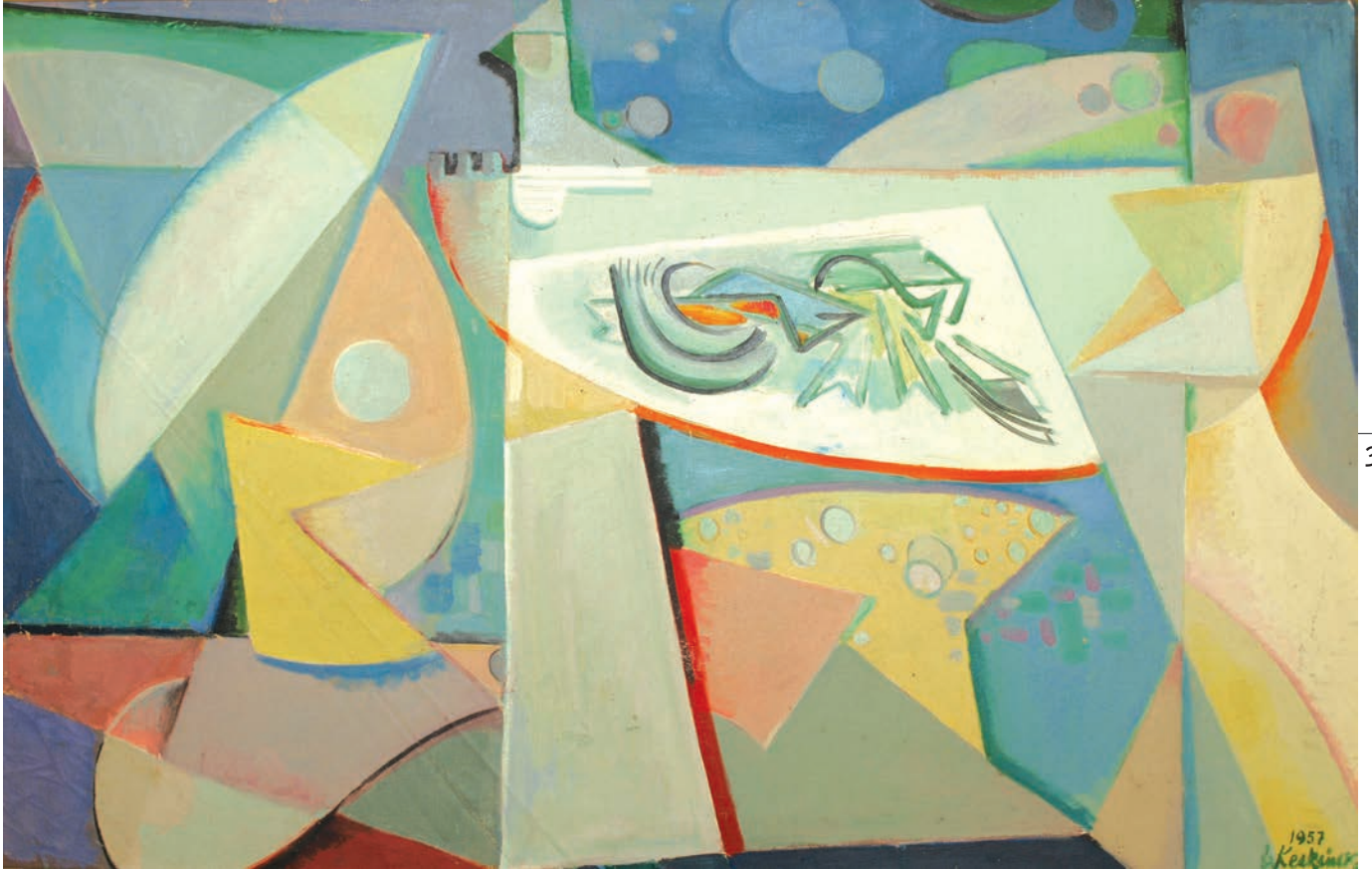
RİTMLER, 1957, 60 x 92.5 Tuval üzerine yağlıboya