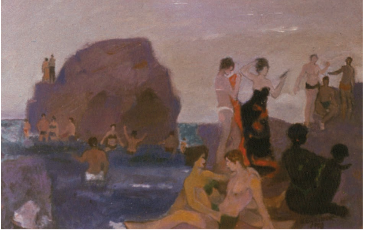
PLAJ, 1978, 42 x 59 Mukavva üzerine yağlıboya