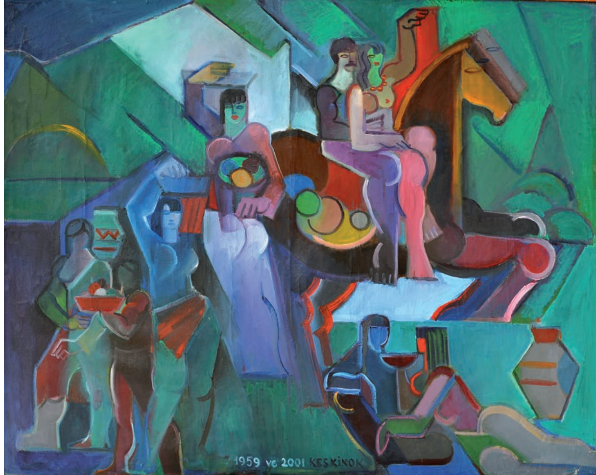
İsimsiz, 1959-2001, 84 x 107 Tual üzerine yağlıboya