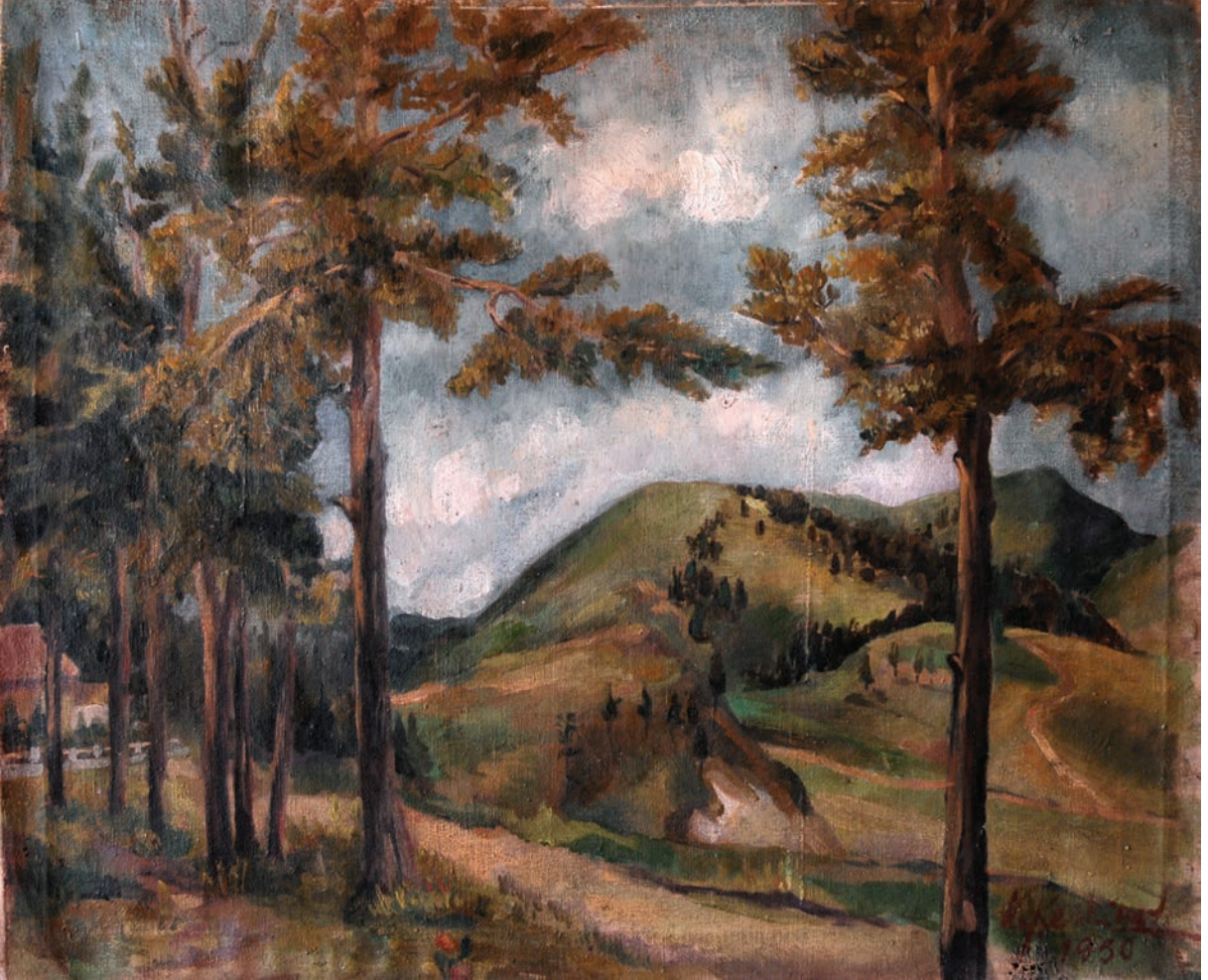
SARIKAMIŞ'TA PEYZAJ, 1950, 55 x 67.5 Tual üzerine yağlıboya