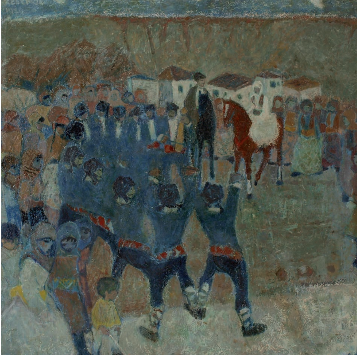
GELİN KARŞILAMA, 1970, 85 x 89 Tual üzerine yağlıboya