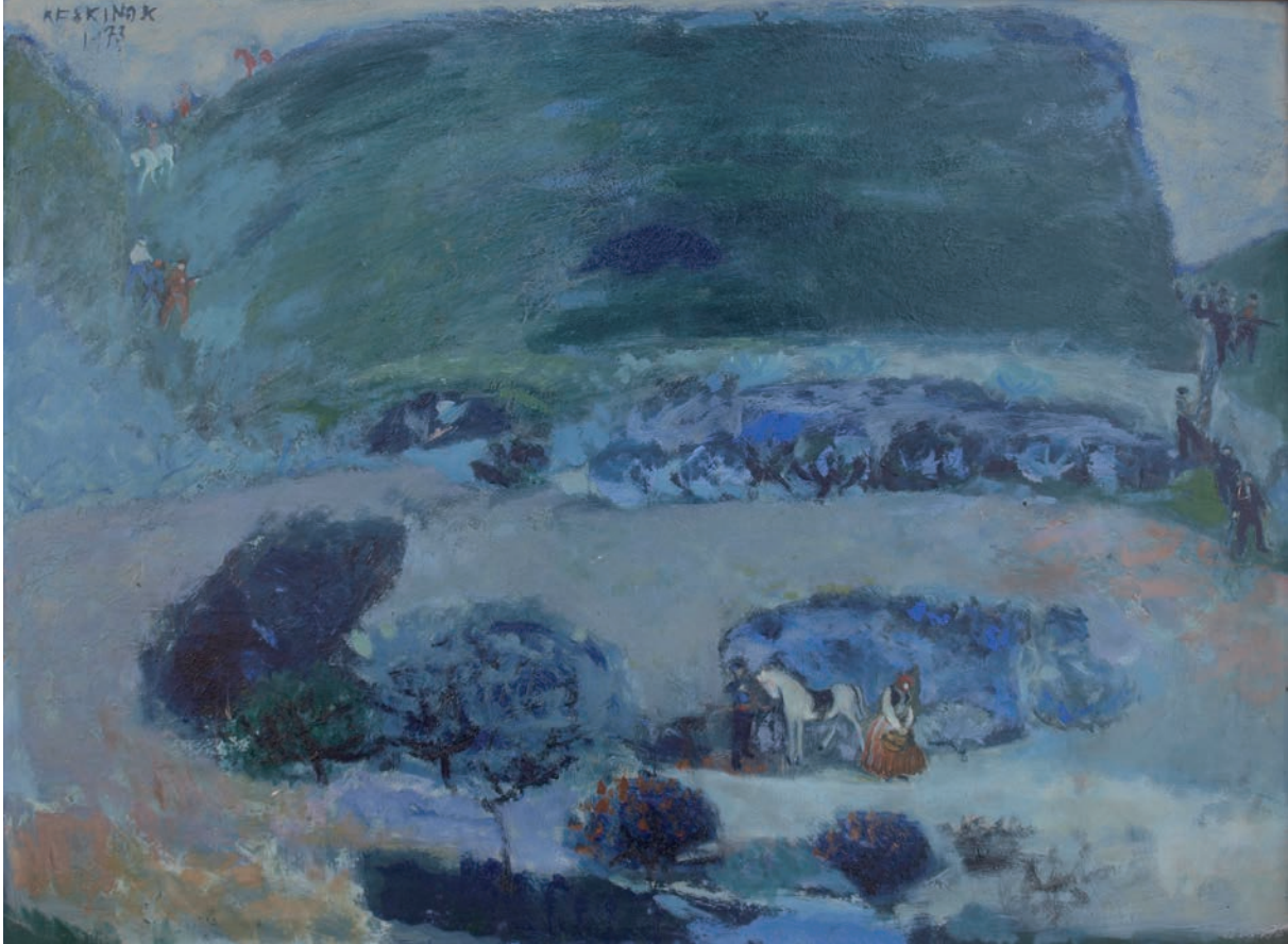
KIZ KAÇIRMA, 1973, 49 x 63 Duralit üzerine yağlıboya