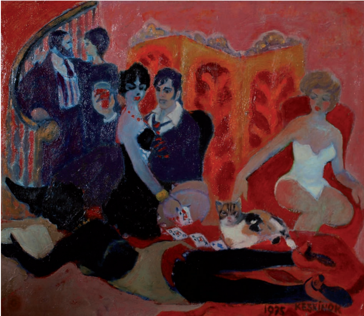
GECE KULÜBÜ, 1975, 39 x 49 Duralit üzerine yağlıboya