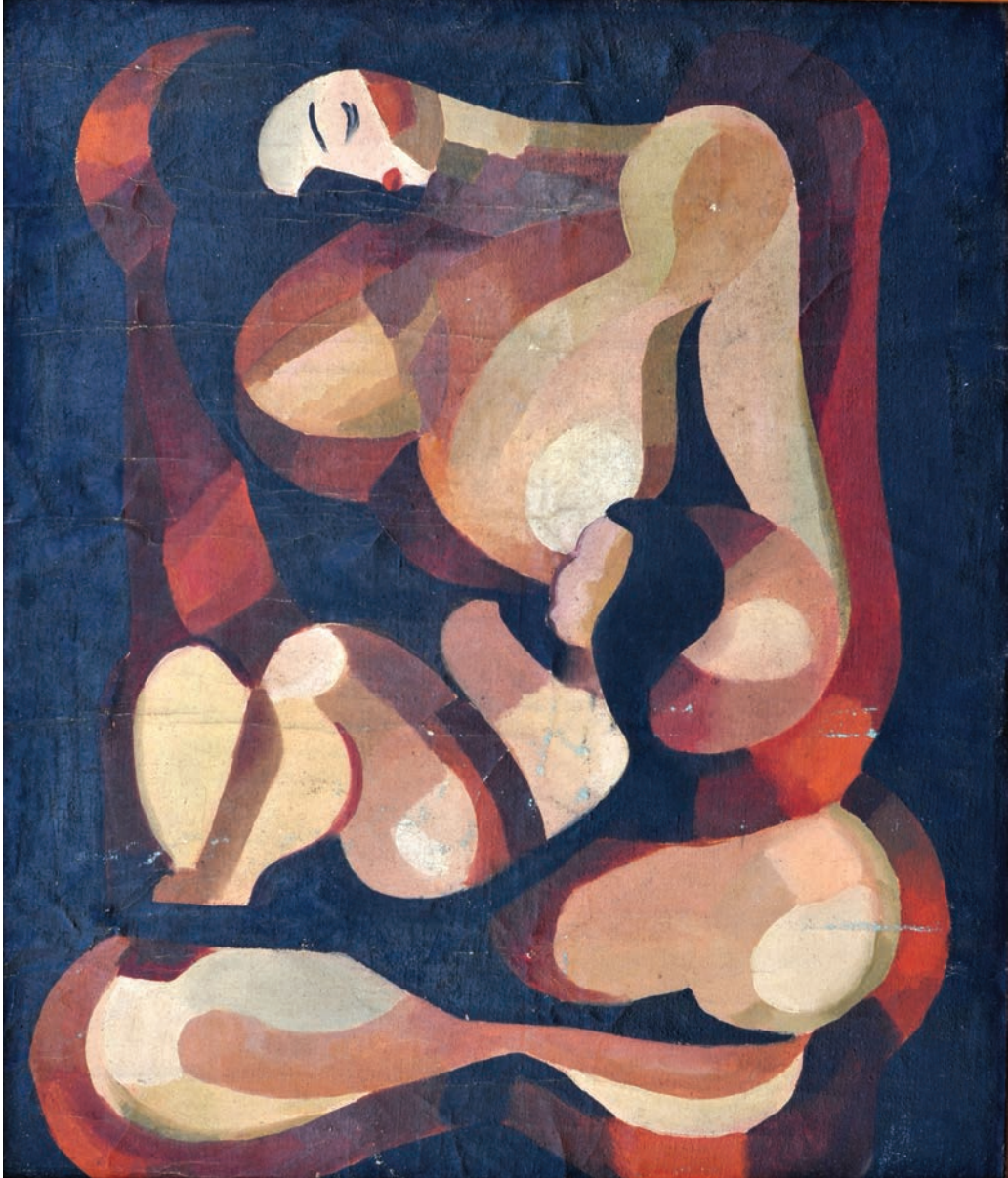
ANA VE ÇOCUĞU, 1956, 57.5 x 49 Tuval üzerine yağlıboya