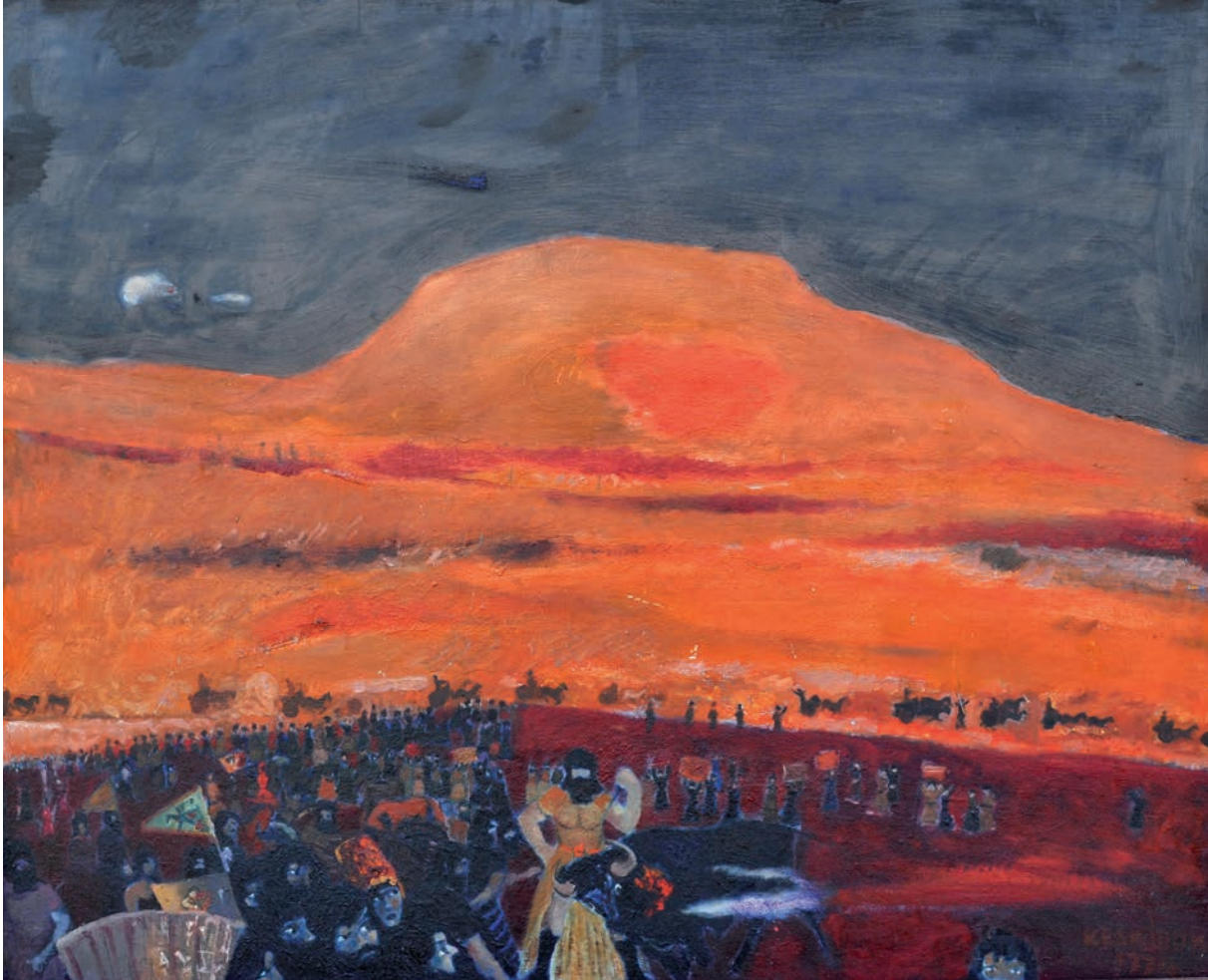
GILGAMIŞ DESTANI, 1974, 81 x 99 Duralit üzerine yağlıboya