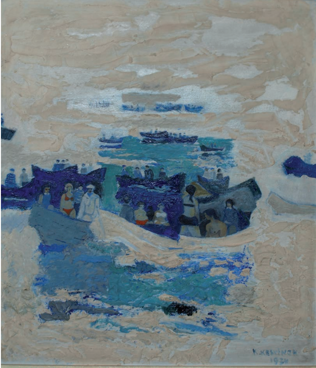
KARADENİZ'DE DENİZ BAYRAMI, 1974, 50 x 40 Tuvall üzerine yağlıboya