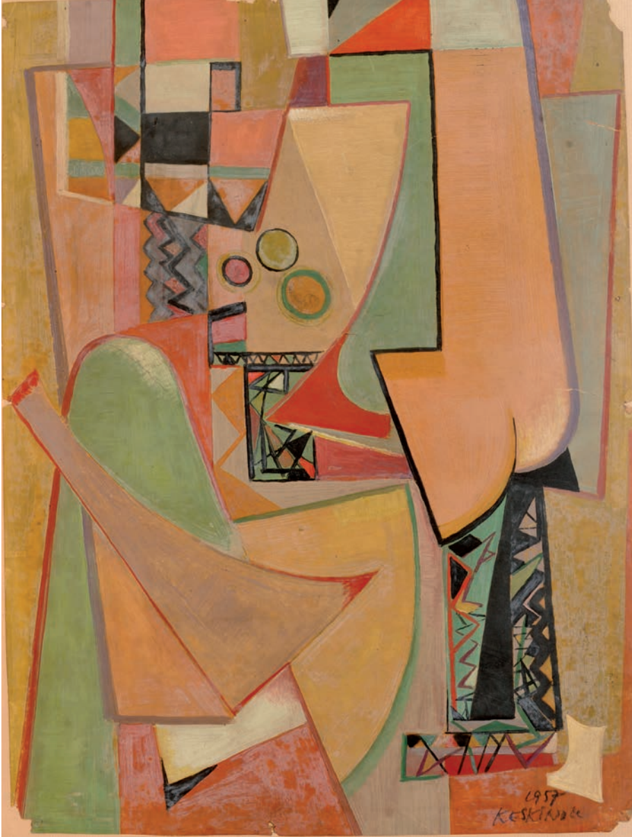
KADIN, 1957, 64 x 47 Kağıt üzerine yağlıboya