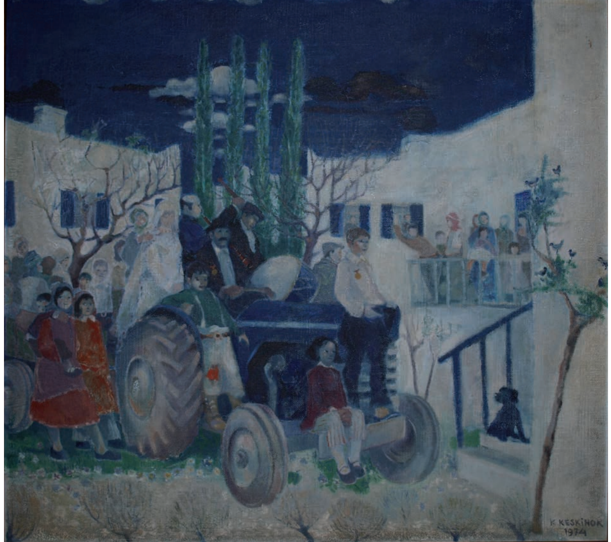
DÜĞÜN, 1974, 100 x 110 Duralit üzerine yağlıboya