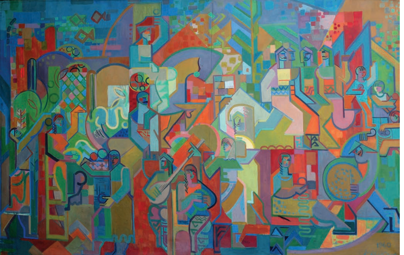
ELMA BAYRAMI, 1960, 118 x 182.5 Tuvall üzerine yağlıboya