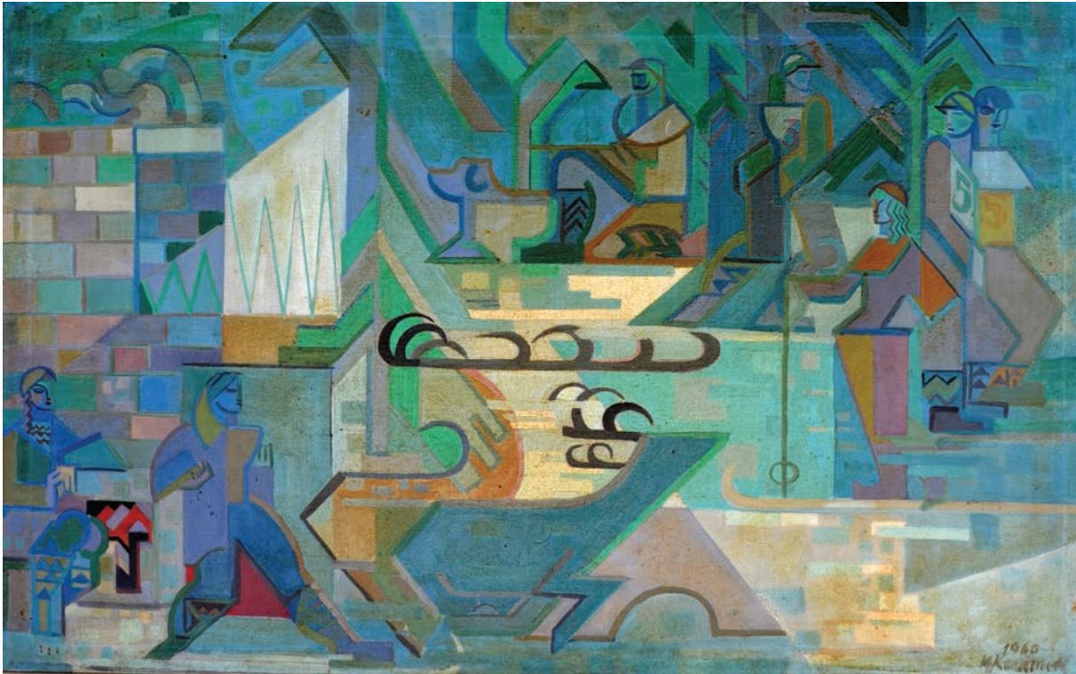
KİŞ SPORLARI, 1960, 71 x 114 Tual üzerine yağlıboya