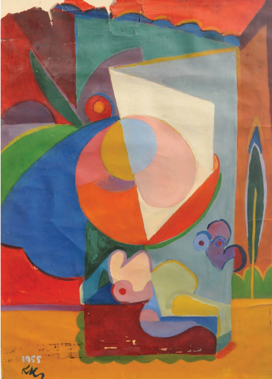
AĞAÇ ALTINDA YATAN KADIN, 1955, 59 x 42 Kağıt üzerine yağlıboya