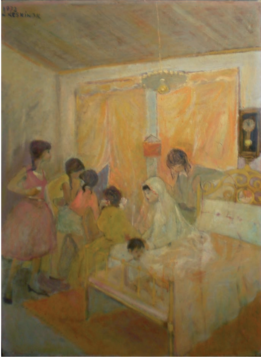
GELİN ODASI, 1972, 95 x 68.5 Tuval üzerine yağlıboya